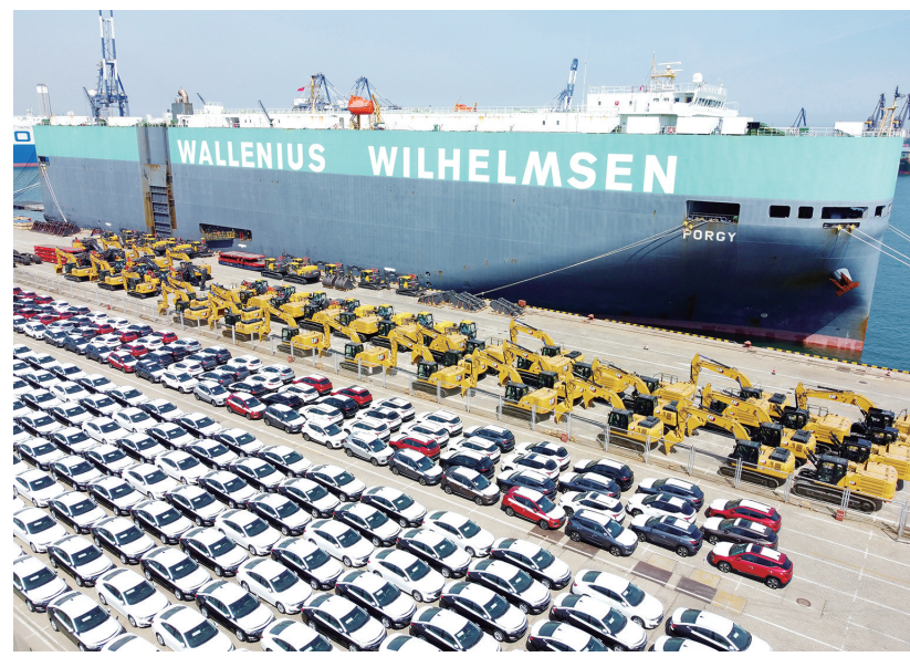
大批出口商品车在山东港口烟台港集结等待装船(5月9日摄,无人机照片)。5月9日,海关总署发布数据,今年前4个月,我国进出口总值12.58万亿元,同比增长7.9%。其中,出口6.97万亿元,同比增长10.3%;进口5.61万亿元,同比增长5%。