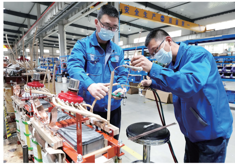
今年以来,河北省积极统筹疫情防控和经济社会发展,落实各项惠企政策,为企业精准纾困解难,力保产业链稳定,多措并举促进经济增长,取得良好效果。据了解,河北省一季度实现生产总值9559.8亿元,同比增长5.2%。图为5月17日,工人在石家庄市鹿泉区科林电气高端智能电力装备制造基地一家电力设备企业车间工作。