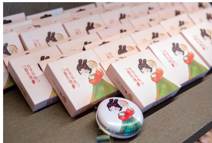
河南博物院拥有丰富的馆藏文物资源,近年来,其文创团队对这些资源进行梳理,设计开发了考古盲盒、棒棒糖、书签、冰箱贴等近1600款精美的文创产品,使文物“活起来”“潮起来”,融入现代生活,受到众多年轻人的追捧。这是在河南博物院文创商店拍摄的“仕女乐队”面包袋(5月17日摄)。