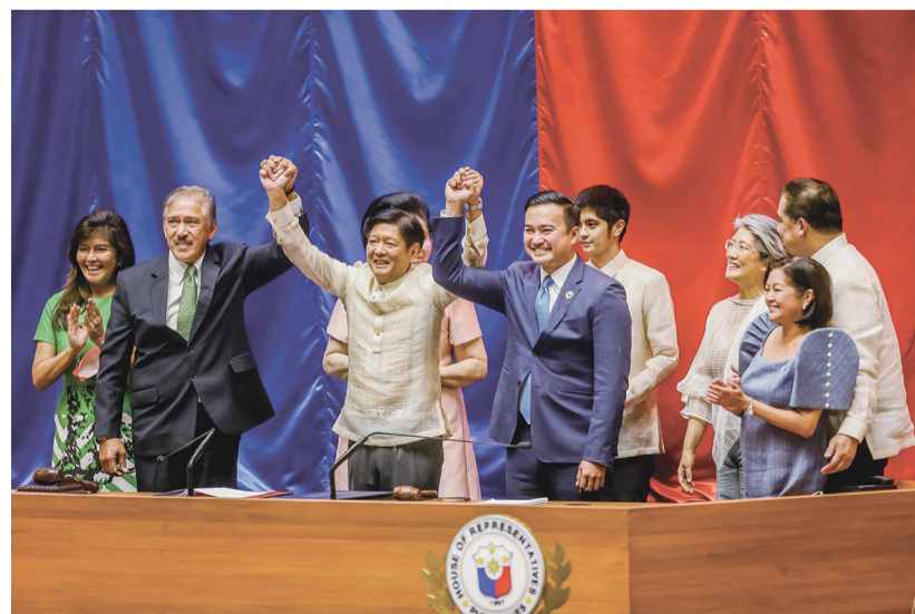
5月25日,在菲律宾奎松城,费迪南德·罗慕尔德兹·马科斯(左三)庆祝赢得总统选举。菲律宾国会25日下午正式确认费迪南德·罗慕尔德兹·马科斯在本月举行的总统选举中获胜,当选菲律宾总统。由菲律宾国会参众两院部分议员组成的验票委员会当天确认选举计票结果,宣布马科斯赢得总统选举,马科斯的竞选搭档、现任总统罗德里戈·杜特尔特的女儿、达沃市市长莎拉·齐默尔曼·杜特尔特-卡彪赢得副总统选举。