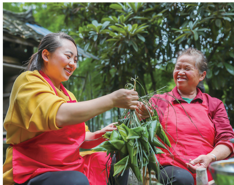
5月25日,村民在贵州省岑巩县思恩镇龙江村包粽子。端午将至,人们用包粽子的方式迎接传统节日的到来。