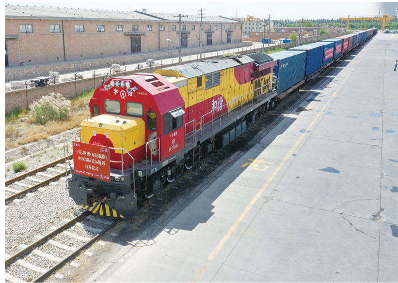
“宁夏——欧洲(布达佩斯)中欧国际货运班列”正式发运(无人机照片,5月26日摄)。当日,“宁夏——欧洲(布达佩斯)中欧国际货运班列”首班列车在位于宁夏银川市的中国外运华中有限公司宁夏分公司铁路专用线正式发运。该列车满载50只40尺集装箱货物,将经阿拉山口出境,途经哈萨克斯坦、俄罗斯、白俄罗斯、波兰等地后,最终抵达匈牙利布达佩斯。此次国际班列的发运,标志着宁夏与欧洲内陆地区点对点班列实现零的突破。